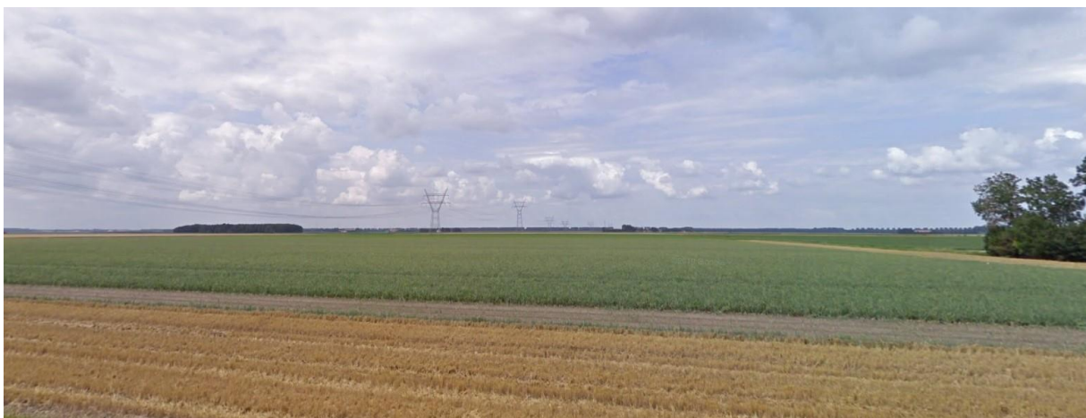
Foto vanaf het Olsterpad, kijkend richting de Hoge Vaart. De twee masten die het dichtstbij staan vanaf dit punt, worden aangepast.

Het gaat om de twee hoogspanningsmasten die – vanaf het Olsterpad gezien – het dichtstbij de Hoge Vaart staan. U ziet deze masten op onderstaande foto ( tekst loopt door onder de foto ).