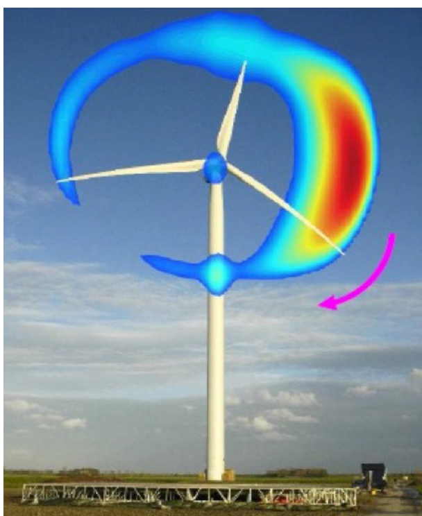
Figuur 1 – De productie van geluid door de draaiende bladen in kleur: hoe roder hoe luider.